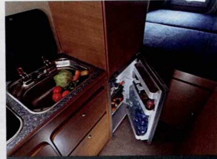
En cuisine : éléments affleurants et réfrigérateur trimixte.