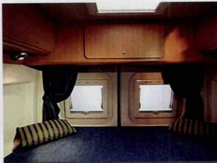
La ligne Swan : des implantations classiques avec lit arrière.