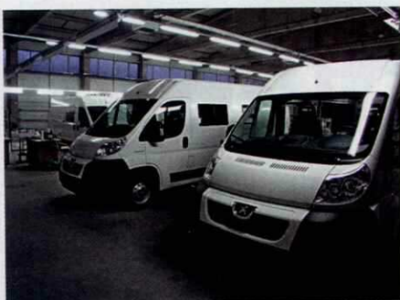
Les ateliers Bravia Mobil sont situés à Straza (Slovénie).